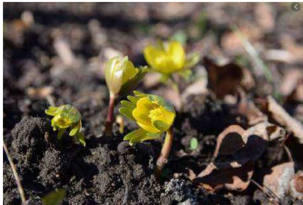
Jednym ze zwiastunów wiosny są pojawiające się kwiaty – krokusy i przebiśniegi.

Kwitnące rośliny cieszą zarówno oczy jak i nosy. Jednak dla osób z alergią to czas szczególnie ciężki. Zwłaszcza, że w powietrzu pocujemy wierzbę, brzozę i topolę. A co ze zwierzętami? Wielkimi krokami zbliża się pierwszy etap rozmnażania. Przykładowo coraz częściej słyszymy kocie miauczenie. Zwierzęta te rozpoczynają właśnie kocie gody, czyli marcowanie – o czym głośno przypominają. Kotka zaczyna miauczeć coraz głośniej nawołując ojca dla swojego potomstwa. Z kolei kocur staje się bardziej agresywny i jest bojowo nastawiony do rywali. Jednak wiosna to nie tylko rozmnażanie, to moment w którym z zimowego snu wybudzają się m.in. borsuki czy niedźwiedzie. Z ciepłych krajów wracają bociany, jaskółki, słowiki i inne ciepłolubne ptaki. Właśnie tak przyroda budzi się do życia!