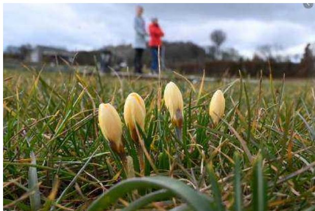
Wiosnę czujemy instynktownie. Czują ją też rośliny i zwierzęta. To w naszym klimacie okres największego rozwoju, prawdziwy początek roku.