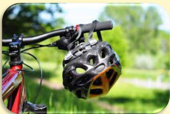
aktywne i bezpieczne spędzanie czasu na świeżym powietrzu